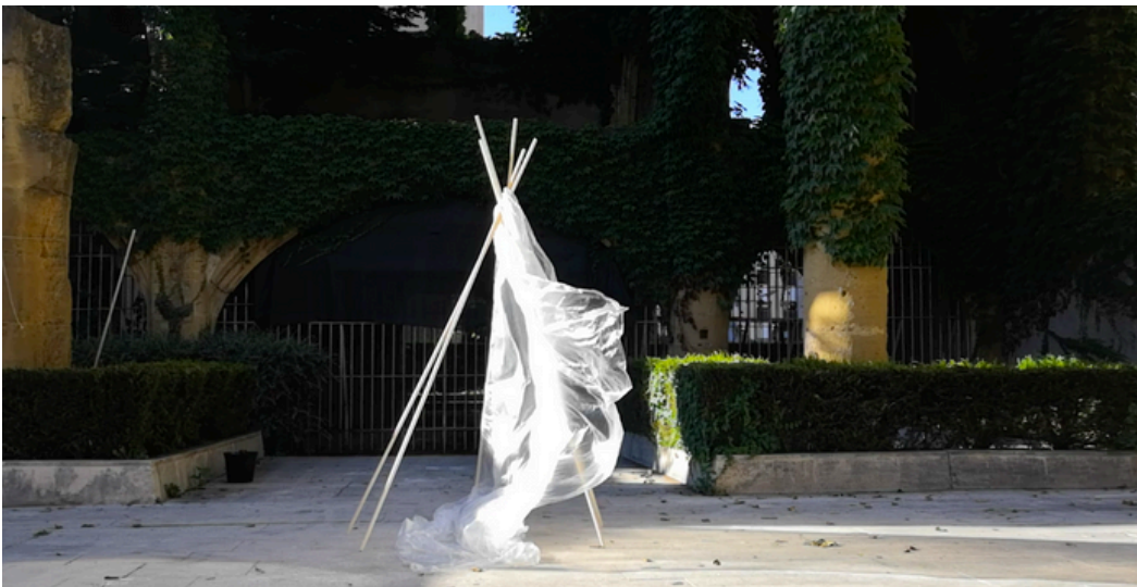
Recherche lors d'une capsule jeune public en 2023.

Une première étape du travail a été de s'imprégner du conte original, de vivre avec lui et de l'explorer sous toutes ces coutures. C'est notamment là que j'ai eu l'occasion d'explorer des formes diverses autour de potentielles scénographies (cf photo). J'ai été beaucoup accompagnée par le livre Femmes qui courent avec les loups de Clarissa Pinkolà Estès et l'analyse unique que l'autrice propose. Au début, je n'imaginai même pas sortir du conte des frères Grimm et ce sont mes discussions avec l'équipe ainsi que mon travail de recherche sur l'origine des contes qui m'ont poussée dans cette voie.